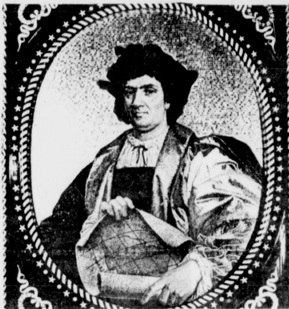
Colón siempre se sintió impulsado a realizar una gran aventura que le diera fama y riquezas.

The nature of the Spanish expeditions on these old trails was such that as the adventurers moved onward, their culture followed not far behind. Indeed on his 1540 expedition, Coronado was accompanied by 225 cavalymen 60 foot soldiers, 5 frairs, about 1,000 Indian escorts, and their provisions including about 1,5000 cattle. It is easy to see the origin of the thousands of longhorn cows which would later roam the