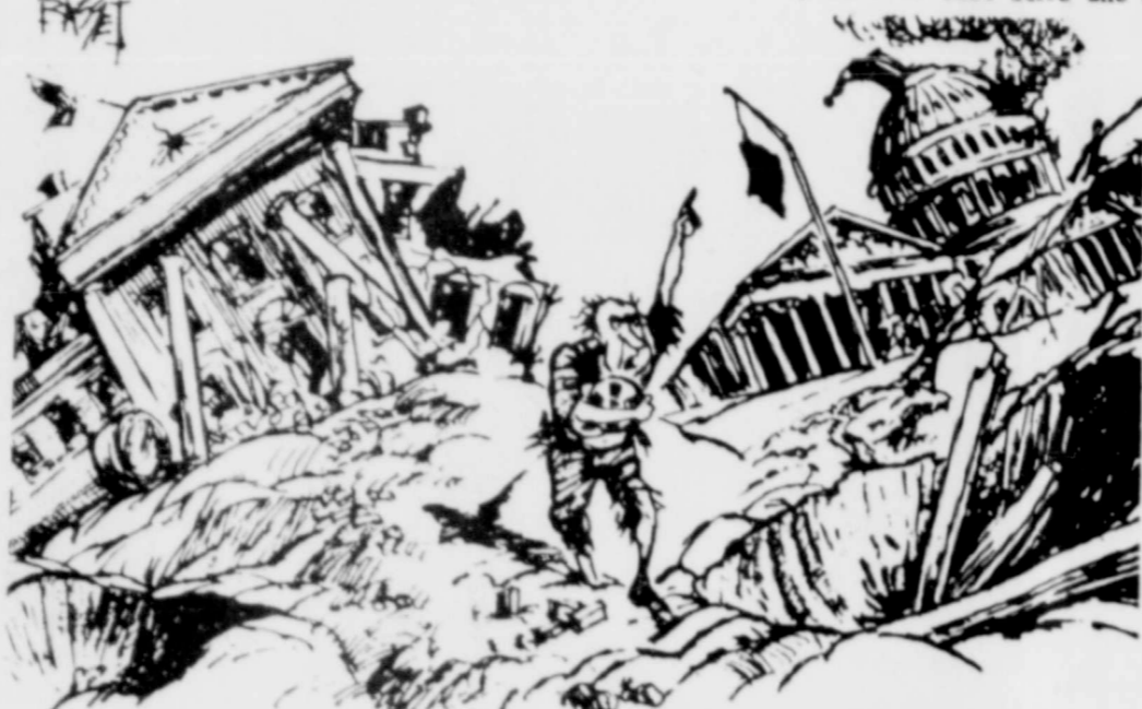
"TODOS ESTAN DESPEDIDOS"....."TODOS ESTAN DESPEDIDOS"

Aún nos espera algo peor. Si seguimos peleándonos unos con otros mejor para el rico así lo dejamos que se prepare mejor.