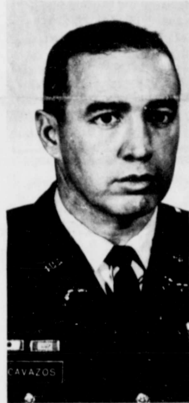
BRIG. GENERAL RICHARD E. CAVAZOS

IF YOU HAVE A QUESTION, GET IN TOUCH WITH YOUR LOCAL SOCIAL SECURITY OFFICE.