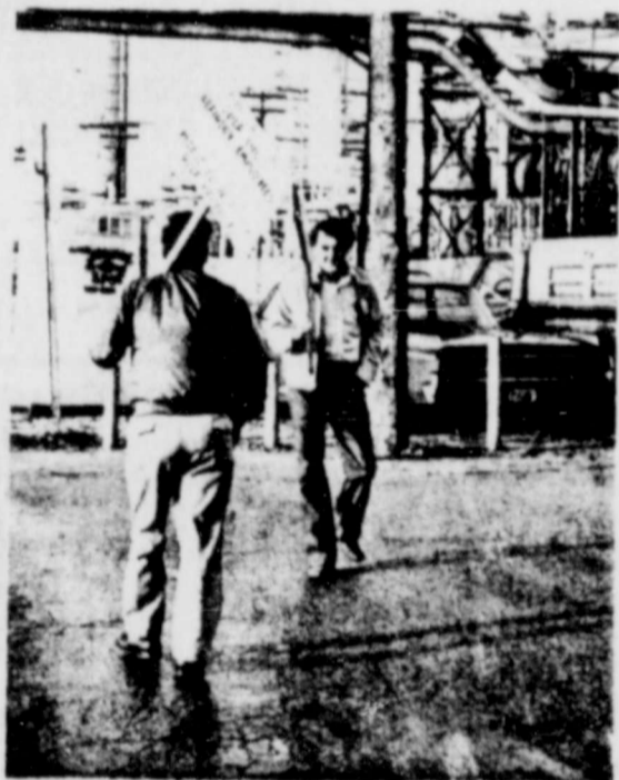
PORT ARTHUR, TEXAS — Una escena que se ha hecho común en Estados Unidos. Un piquete de huelguistas demandando mejores condiciones económicas debido a la inflación. En la foto, dos huelguistas de la refinería Gulf Oil.

Al citar estadísticas oficiales, el estudio señala que el control que ejerce el sector privado en empresas, ventas y producción se encuentra actualmente tan concentrado que ello inevitablemente crea inflación, cesantía y