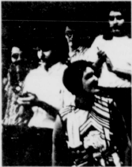
Come Together Chicanos

The Chicano community rallied and struggled with even more determination. The increasing dynamic cohesiveness of Chicano organizations during this period resulted in enormous, massive community demonstrations such as August 29, 1970 when Ruben Salazar was killed, and the