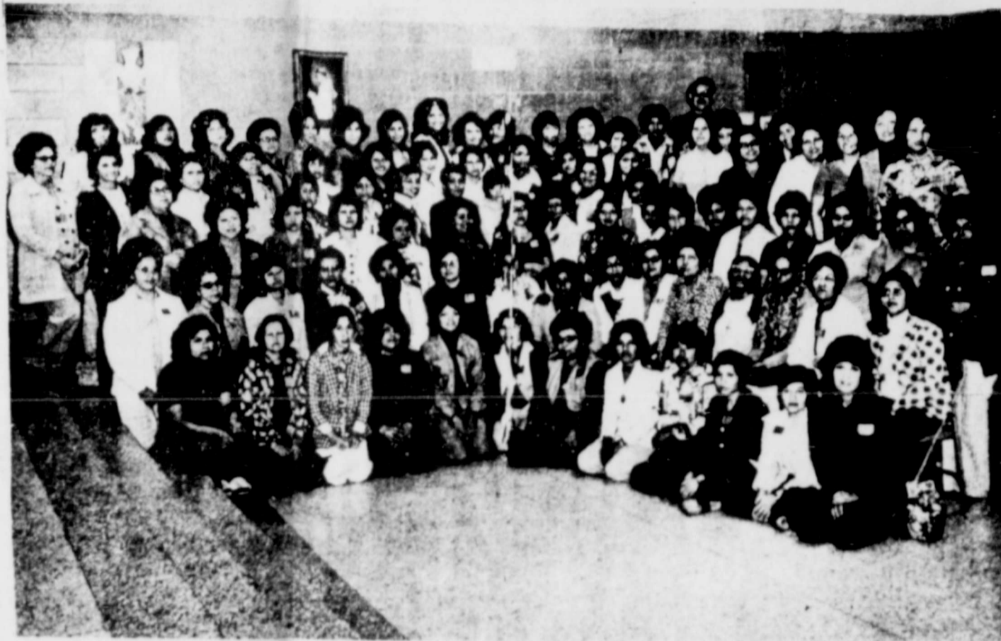
Esta es una foto de las personas que asistieron a la Jornada la Semana pasada, en el Centro Cursillista

Dice el periódico que el estudio especifica que un nuevo convenio de "braceros" no solucionaría el problema "sino que lo agravaría más, ya que por un lado aumentaría el número de ilegales al no poder obtener todos los posibles candidatos un contrato de trabajo y por el otro, residentes mexicanos y los mexicanos-norteamericanos verían afectados gravemente sus propios trabajos frente a posibles "rompehuelgas", que aceptarían sin duda condiciones menos favorables".