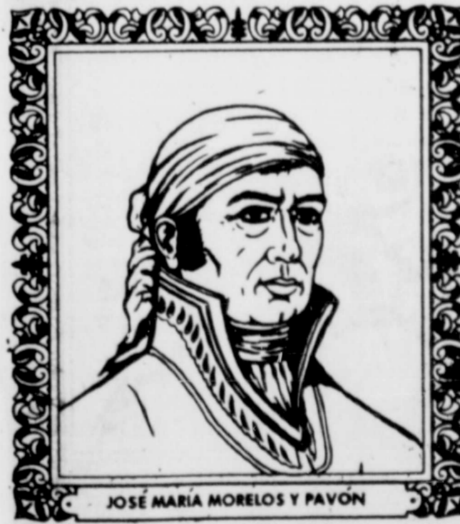
JOSE MARIA MORELOS Y PAVON

La Corregidora de Querétaro. Estudió en el Colegio de las Vicuñas de la Ciudad de México y se casó con Don Miguel Domínguez, corregidor de Querétaro. Gracias a su valor Hidalgo, Allende y otros patriotas no fueron capturados por el ejército realista. Estuvo presa tres años en un convento de México. De su energía y entereza son buena prueba los reproches que dirigió a Hidalgo por la matanza de Granaditas (1764 - 1829).