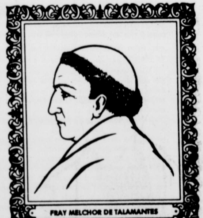
FRAY MELCHOR DE TALAMANTES

Héroe insurgente. Nació en San Miguel el Grande; (1782 - 1843) se llamaba Juan José de los Reyes Martínez. Era minero en Guanajuato y se enroló en las filas del cura Hidalgo. Los insurgentes tenían sitiada la Alhóndiga de Granaditas, donde se habían hecho fuertes de, logró acercarse a la muralla e incendiar una de las puertas, facilitando el escape de los insurgentes.