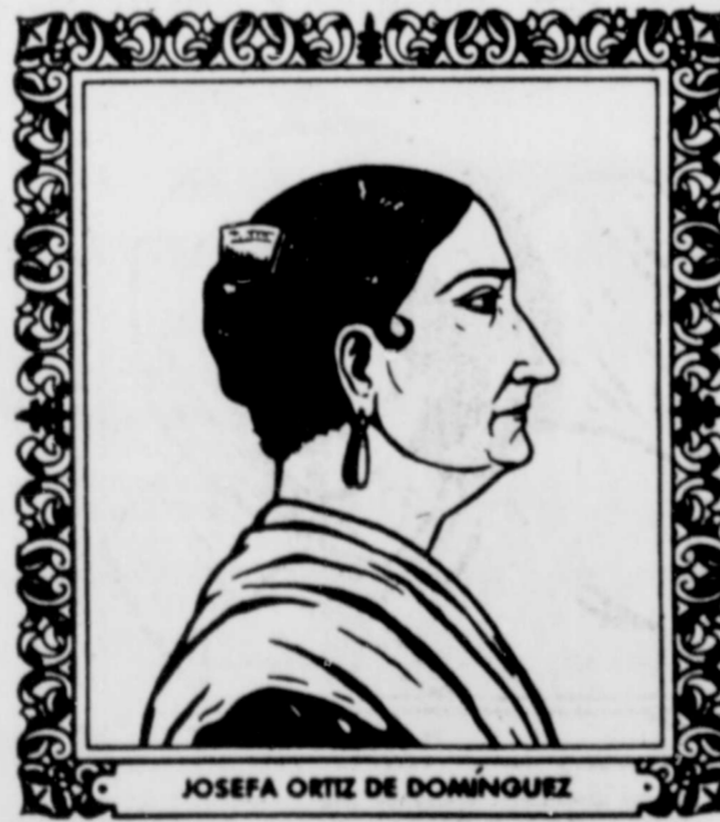
JOSEFA ORTIZ DE DOMINGUEZ

Caudillo de la independencia mexicana. (1770 - 1814). Se levantó en Janteteco, Mor. Coronel en el ejército de Morelos. Intervino en el sitio de Cuautla, plaza que defendió con brío y honor. Se cubrió de gloria en el sitio de San Agustín del Palmar. Hecho prisionero en Puruandiro fue fusilado en Valladolid (Morelia); su muerte constituyó una pérdida irreparable para la causa de la independencia.