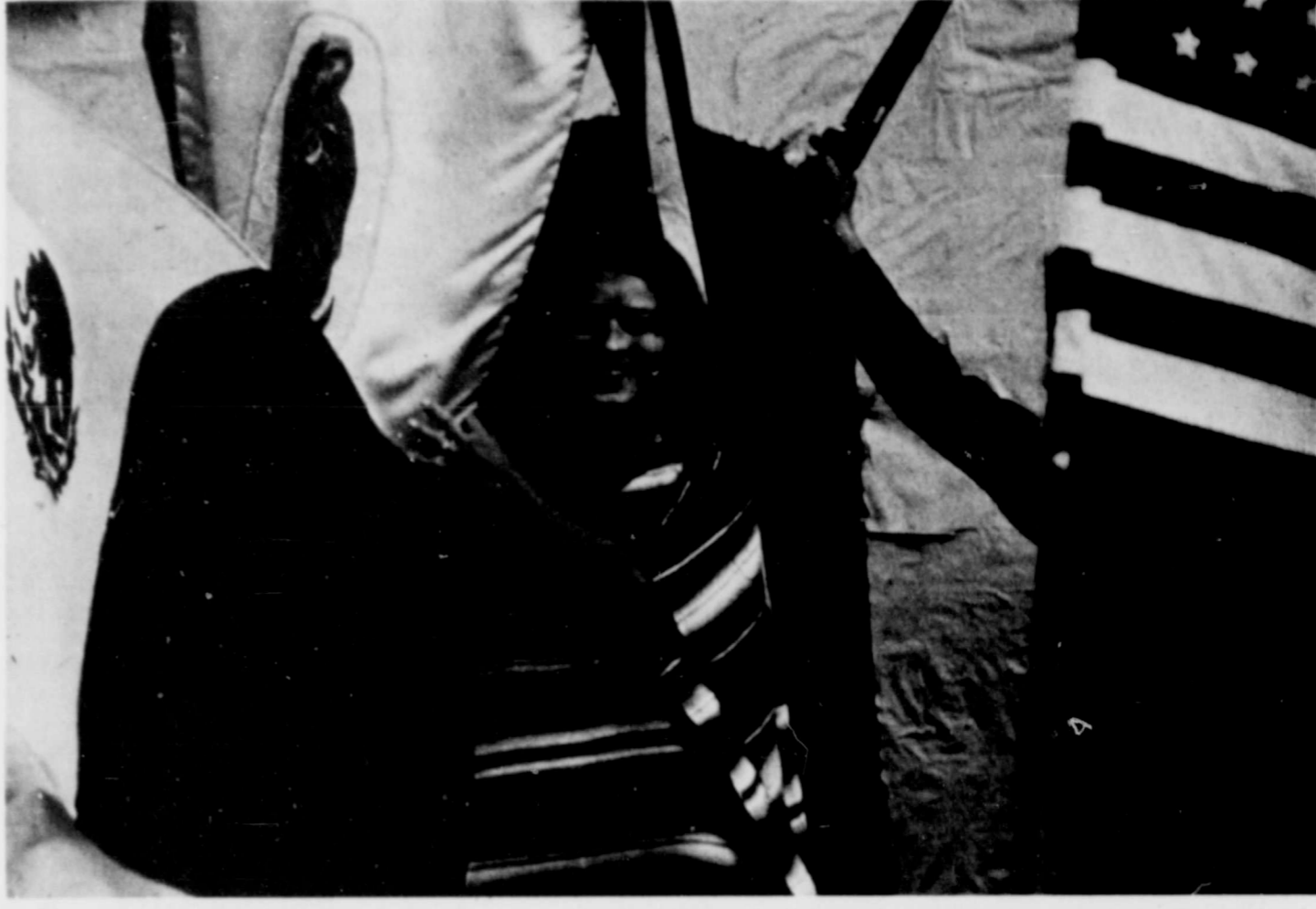
ENTRE UNA DE LAS ACTIVIDADES QUE SE LLEVARA ACABO PARA CELEBRAR EL DIEZ-Y-SEIS DE SEPTIEMBRE ES UN DISFILE QUE FUE ORGANIZADO POR LA LOGIA MASONIC LIB. NO. 19. EL DISFILE SE LLEVARA ACABO EL MARTES DIA 16 DE SEPTIEMBRE. ESTE FOTO ES DE EL ULTIMO DISFILE QUE SE LLEVO ACABO AQUI EN LUBBOCK PARA CELEBRAR EL 16. FUE ORGANIZADO POR LA ORGANIZACION MAYO EN 1971.

En cuanto a la forma popular y particular de celebrar el 16, pues eso queda a la decision y gusto de cada comunidad, pero