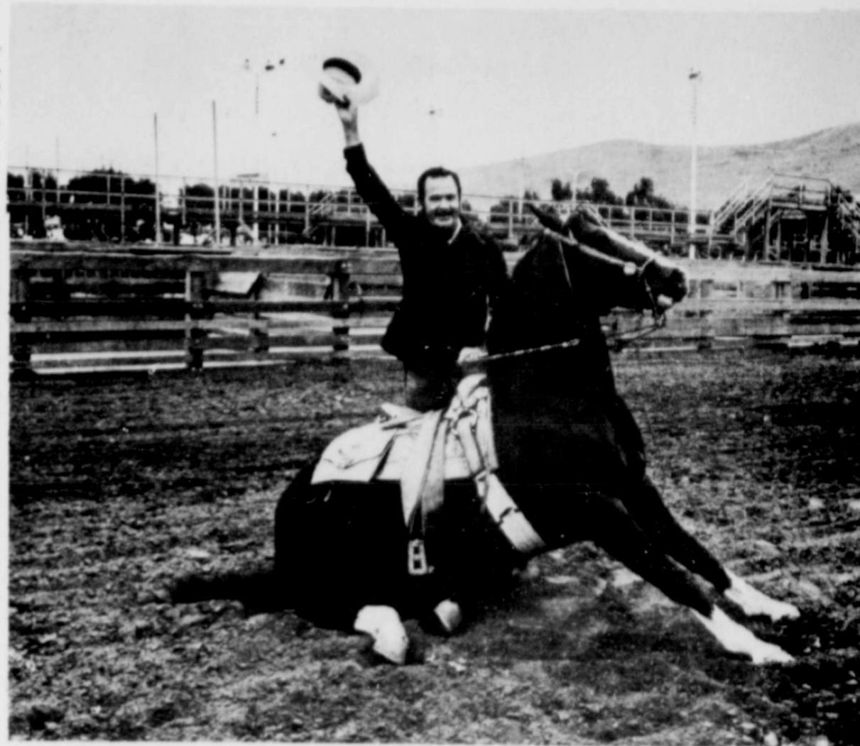
Antonio Aguilar hara una presentacion aqui en Lubbock (vea anuncio) con su fabulosa rodeo y charriada. El Rodeo Nacional de Mexico da una presentacion en Lubbock cada ano.