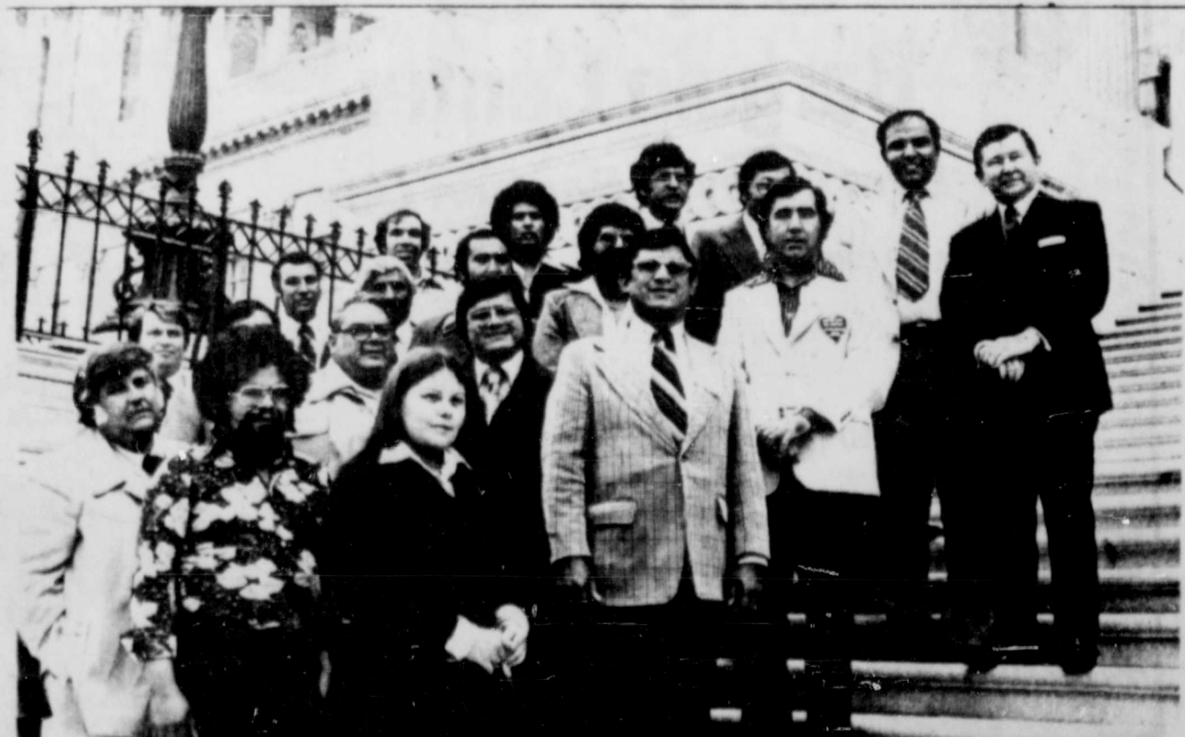
En esta foto se encuentra la mayor porcion de los representantes de TAMACC, frente al capitolio, en la reciente visita a la ciudad de Washington, D.C.