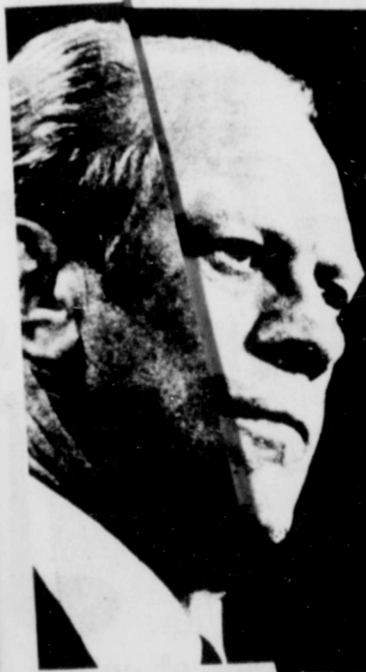
Gerald R. FORD President