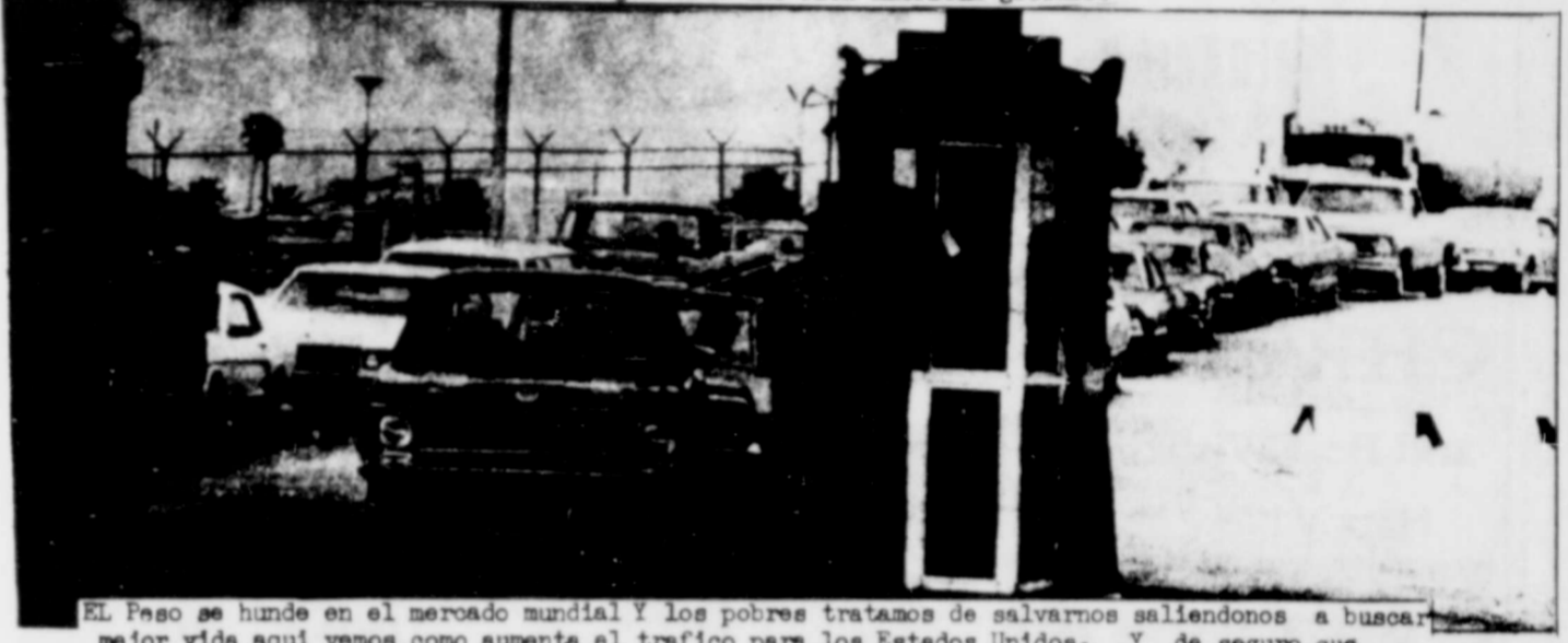
El Peso se hunde en el mercado mundial y los pobres tratamos de salvarnos saliendo a buscar mejor vida aqui vemos como aumenta el trafico para los Estados Unidos. Y de seguro que vienen a buscar mejor vida con aquellos que son Responsables de nuestra desgracia O sea El Rico patron Americano

El Peso continues to be devalued on the world market and the poor continued to cross our border in greater numbers to try to keep up with the devalued peso. They cross the border looking to the U.S. for better life and end up where it all began with the rich American growers.