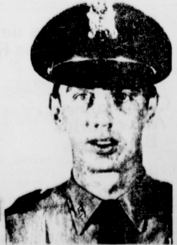
decisión del Jurado después de haber escuchado las abrumadoras pruebas en contra de ambos individuos, los que fueron expulsados por este hecho del Departamento de Policía de Houston