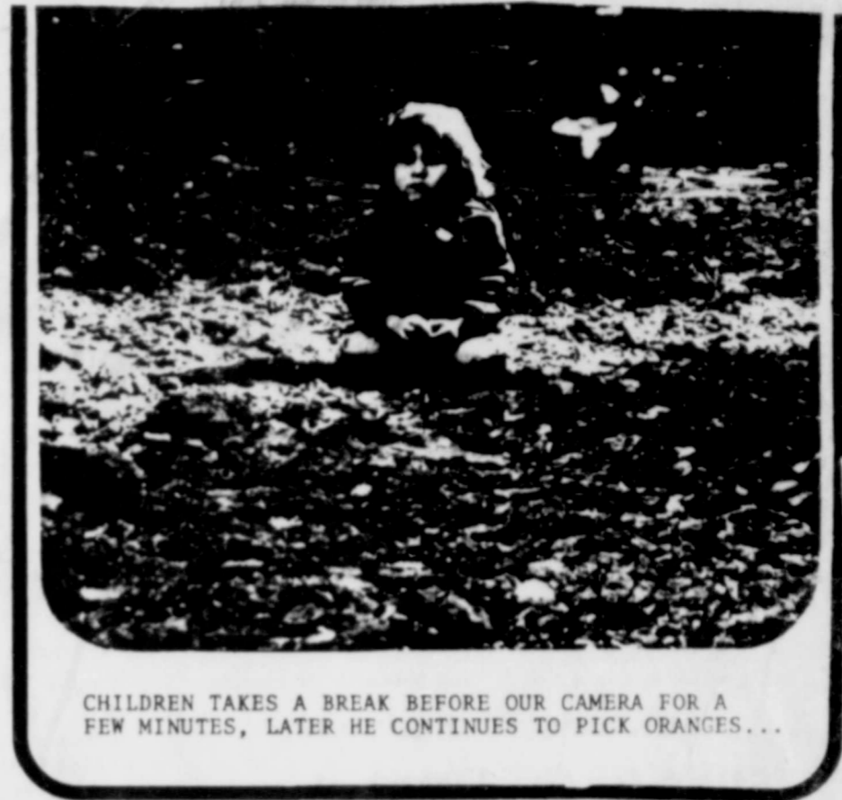
CHILDREN TAKES A BREAK BEFORE OUR CAMERA FOR A FEW MINUTES, LATER HE CONTINUES TO PICK ORANGES...

"EQUAL EMPLOYMENT OPPORTUNITY THROUGH AFFIRMATIVE ACTION"