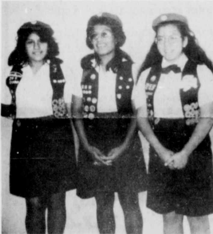
GIRL SCOUTS CAMPARAN EN RIO BLANCO

El campo del Rio Blanco abrirá sus puertas anchas en la tarde de Junio 11, para dar la bienvenida a los primeros y segundos camperos del verano.