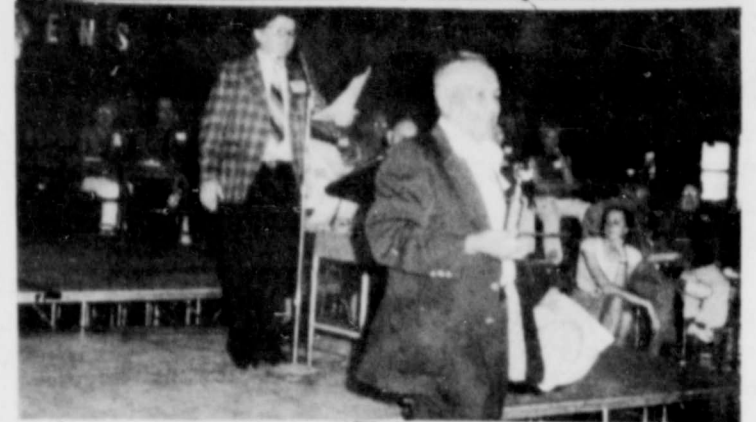
Estas son mas fotos de los Sr. Ci-izens de Emanuel durante las fiestas en Lubbock Fair Park Coliseum