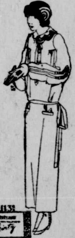
1133 Patent Hart

Die beste Musik der Welt in Ihrem Heim Ihr Leben lang