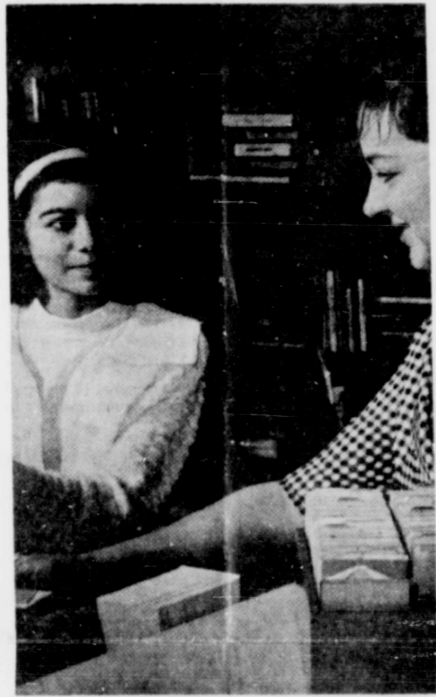
Lamina de la película "Hacia Nuevos Horizontes-La Oportunidad" que será pasada en La Escuela Guadalupe. Vea artículo.