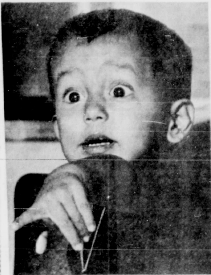
Does my vote really count? Y que vale mi voto?

Lord of the blue eyes! Lord of the scarlet mouth and of the light forelocks as the ripe gold wheat, grant me a dream to wrap my human bareness eternal and stitcheless as your blue robe.