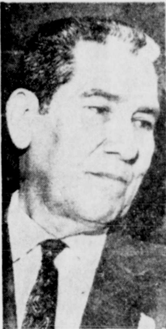
GOES INTO EXILE - Deposed President Arnulfo Arias of Panama left his refuge in the Canal Zone and took a U. S. Air Force plane into exile. His first stop Tuesday was in Washington, D. C. Arias was overthrown by Panama's army on Oct. 11.

FROM WASHINGTON -- MOVIE ON MEXICAN-AMERICANS