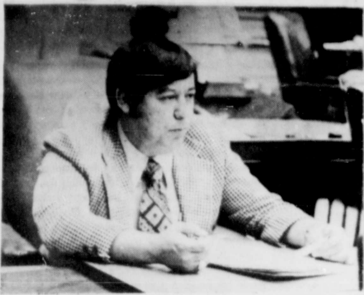
Rep. Froy Salinas