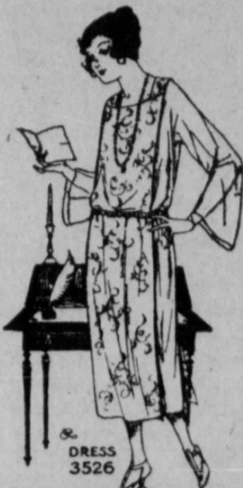
PATTERN DELTOR is provided for this BUTTERICK DESIGN