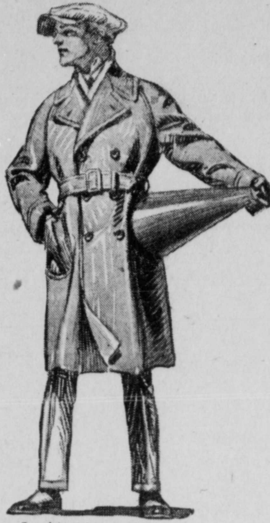
Copyright 1922 Hart Schaffner & Marx