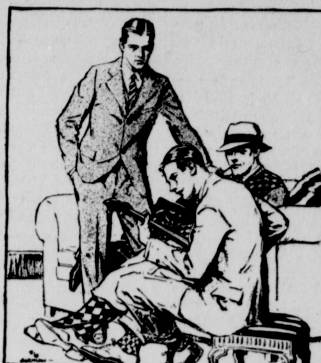
Copyright 1924 Hart Schaffner & Marx