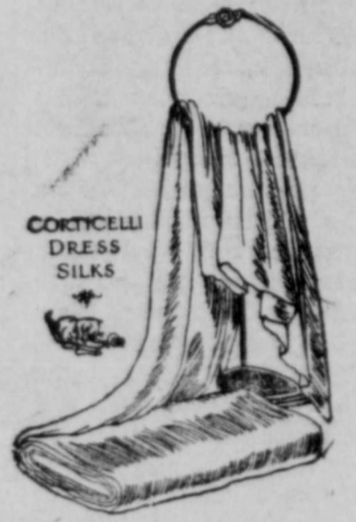
CORTICELLI DRESS SILKS

Die Muster dieser figurierten Seidenstoffe sind wirklich entzückend: sie sind klein und zierlich, in bezaubernden farbenkombinationen. Die Farben harmonisieren mit dem Besatz in irgend einer gewünschten Schattierung.