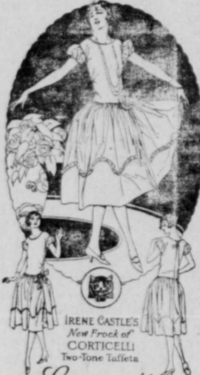
IRENE CASTLE'S New Frock of CORTICELLI Two-Tone Taffeta