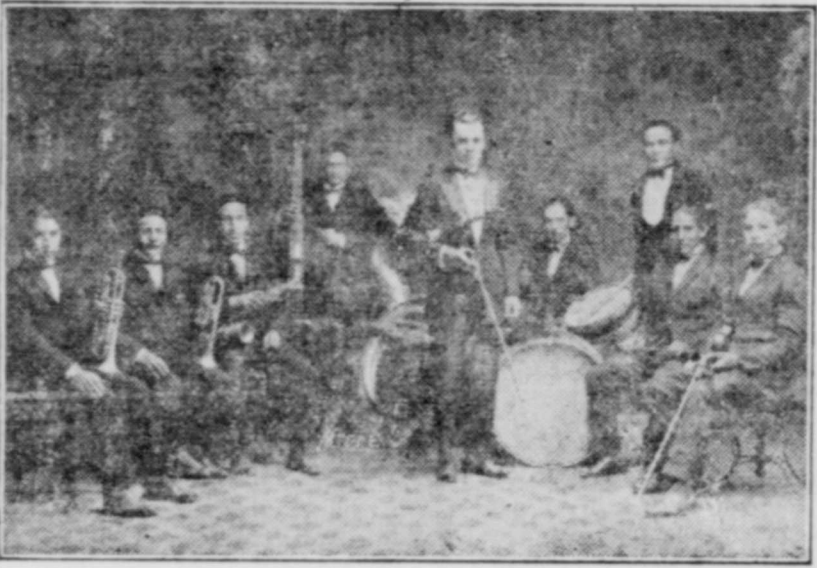
The Haskell Indian Symphonic Band which is to be one of the outstanding features of the "double headline" program of this year's Chautauqua is a brilliant example of the change in the method of living of the original American.

Haskell Band Demonstrates Indian Progress.